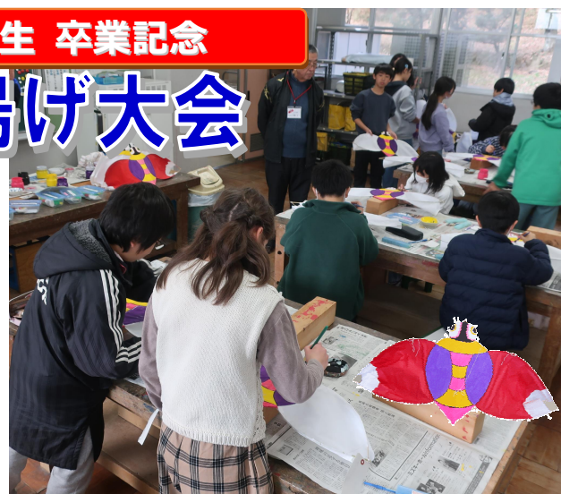
▲せんみ風の色付けをする児童の皆さん【写真は令和 6 年度の様子】

※雨天の場合は体育館で行うため、 見学はできません。 ※駐車場はありませんので、徒歩または公共交通機関などのご利用をお願いします。