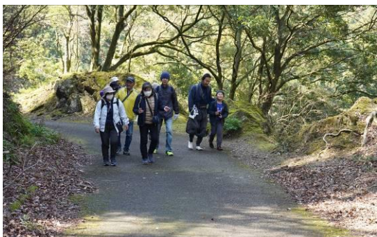
▲ハイキング道はみんなでゆっくり歩きました