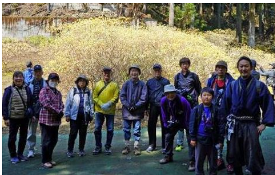
▲ミツマタをバックに参加者の記念撮影

春の訪れを告げる七沢・不動尻のミツマタ群生地。絶好の天候に恵まれた3月21日、黄色い花で覆われた不動尻広場を目指し約1時間のハイキング。そして不動尻広場では、ミツマタの黄色い花で覆われた光景を楽しみながらカメラのシャッターを切ったり、その先の不動の滝まで足を伸ばしたりして、1時間余り思い思いに過ごしました。ある参加者は「この七沢で、このような自然に恵まれ、豊かに暮らしていることに改めて感謝したい」と話し、感動ひとしおでした。