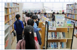
図書室を見る毛利台小の児童

児童たちは好奇心いっぱい各部屋 を見て回り、「何人が働いていますか」「災 害のときは避難場所になりますか」「公 民館は何時まで開いていますか」など、 たくさんの質問をしていました。