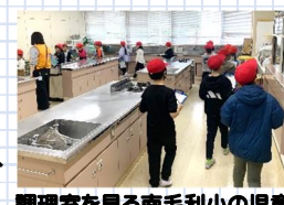
調理室を見る南毛利小の児童