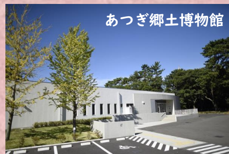
あつぎ郷土博物館

【申込み】 12月27日(土)までに講座予約システム(番号:00895)、南毛利公民館に電話または直接申込み。応募多数の場合、抽選。抽選結果は、システム申込みの場合はLINEまたはメールで、電話・直接申込みの場合は、ハガキでお知らせします。抽選結果は必ずご確認ください。