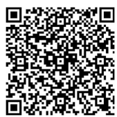
あゆコロちゃんと学ぶ住警器

家具等の転倒防止（固定）対策、避難路の確保、住宅用火災警報器の適切な維持管理や住宅用消火器の設置など事前の対策を図るほか、地震発生後には電化製品のスイッチを切るとともに、電源プラグをコンセントから抜きましょう。また、通電火災を防ぐため、避難するときはブレーカーを落とし、再通電時は電気機器類に破損がないこと、近くに燃えやすいものがないことを確認しましょう。