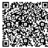
あゆコロちゃんと学ぶ消火器