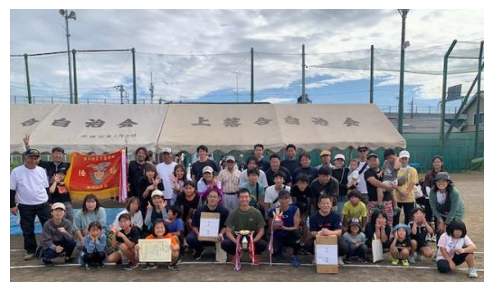
優勝：上落合チーム