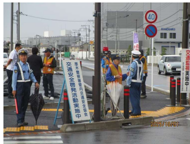
JAあつぎ相川支所前入口で啓発