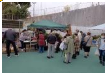
令和5年度公民館まつり