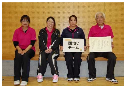
準優勝 団地Cチーム