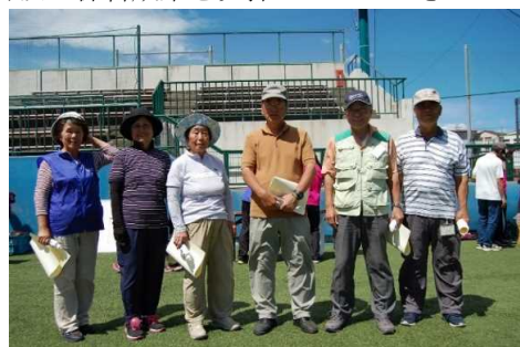
(写真中央から優勝者、準優勝者、3位)

雨で順延となりましたが、翌週、晴天の中グラウンドゴルフ大会が開催されました。普段の練習成果を発揮していただきました。