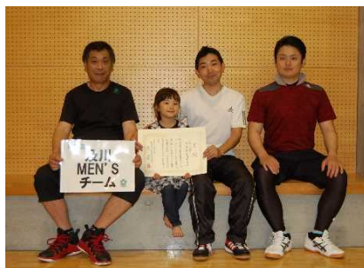
準優勝 及川men'sチーム