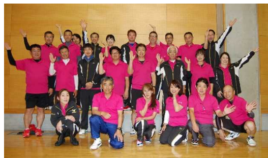
睦合西地区体育振興会の皆さん