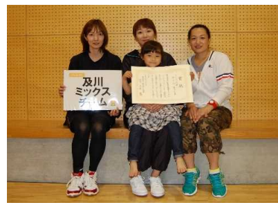
3位 及川ミックスチーム