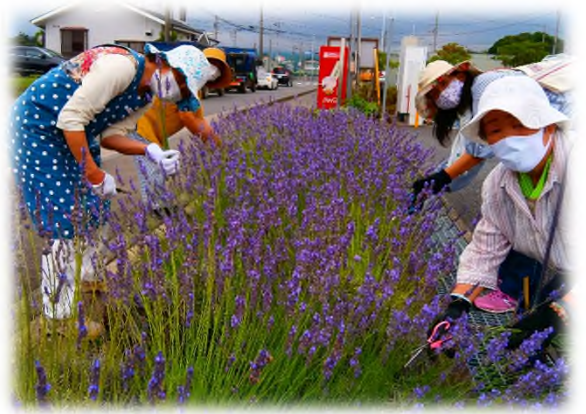
香りに包まれて至福のラベンダー刈り

新しい生活様式が加わり、使用前後の机の消毒、手指の消毒、体温チェック、マスクの着用など、一人ひとりの協力があり、久しぶりの楽しい学級講座となりました。