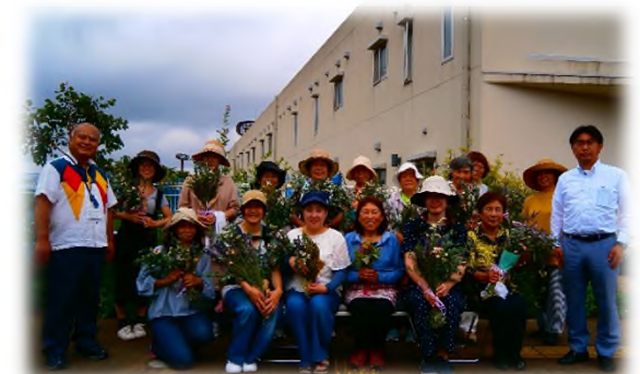
最後にマスクを取って記念撮影

「花にパワーをもらった。とても楽しかった。」参加者の皆さんは、香りと花の力に癒され、心が満たされたようです。こんな時期なので、公民館事業は、やれないことも制約もありますが、対策をしたうえで地域の学びを止めないことが、大切だと感じました。