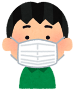
避難所でも マスク着用

普段から災害時の備えは大切です。コロナ禍での在宅避難も念頭に入れて、避難場所への持ち出し品を用意しましょう。もし、停電したら、水道や火が使えなくなったら、トイレが使えなくなったらどうしたらよいか家族で考えておきましょう。「厚木市防災ポケットブック」は公民館でも配布しています。確認しておきましょう。