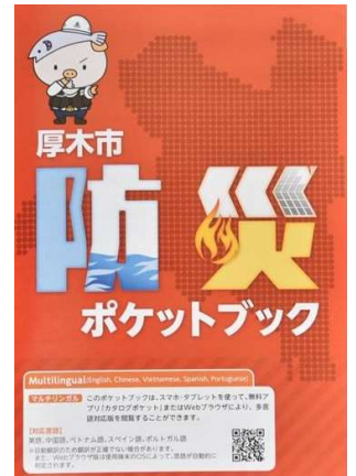
公民館で配布しています