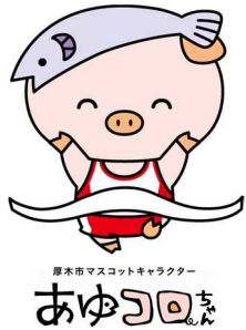
厚木市マスコットキャラクター あゆ回(荻野)